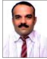
ಮಲ್ಲೇಂಗಡ ಎನ್. ಲವ