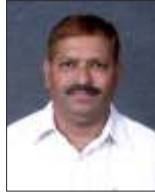
ಗೌಡಂಡ ಯು. ಪೂವಯ್ಯ