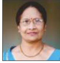
ಮುಕ್ಯಾಟೀರ ವಾಣಿ ನಾಣಯ್ಯ ಉಪಾಧ್ಯಕ್ಷಿಣಿ